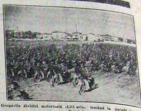
Grupurile diviziei motorizate „Litt orja”, trecând în paradă în fața Duceului